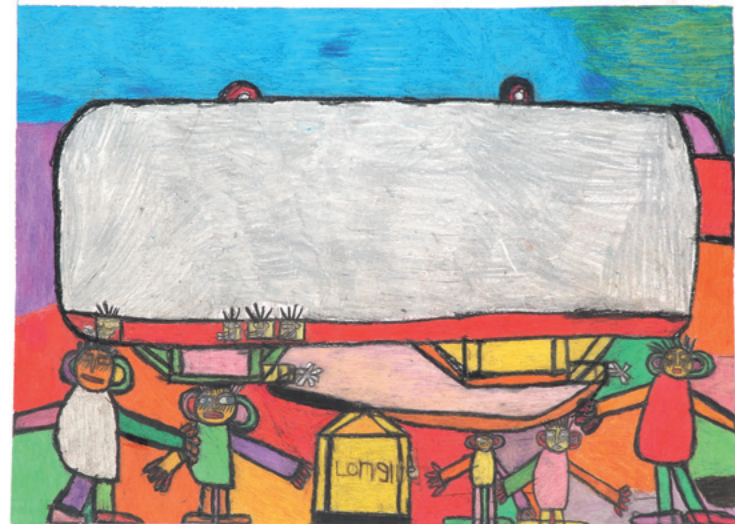
Georg Würz Luftschiff, 1997 Buntstifte und Ölkreide auf Papier 61 x 84 cm Sammlung Würth, Inv. 5602

Expressiv, abstrakt, figurativ, konzeptionell, realistisch, zurückhaltend, bunt, schrill, tiefgründig – es gibt viele Möglichkeiten, Kunst zu beschreiben. Kunst ist vielfältig und künstlerisches Schaffen ist meist direkter Ausdruck von inneren Bildern und Träumen, der nach außen als individuelle Leistung gezeigt wird. Genauso vielfältig wie ihre Kunst sind die Kunstschaffenden, die unabhängig von ihrer Herkunft, ihrer Orientierung oder ihrem Werdegang eine Möglichkeit bekommen sollten, ihre Kunstwerke einer