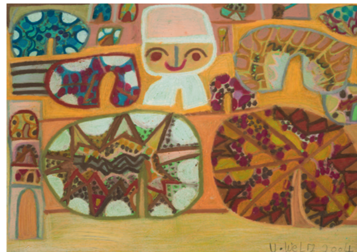
Ulrike Welz Torten vom Bäcker, 2004 Pastell-Ölkreide auf Papier 46,4 x 66,5 cm Sammlung Würth, Inv. 9859

Since the 1990s, art by people with assistance needs has been a natural part of the Würth Collection and more than 140 paintings, drawings and objects of 50 artists from its rich repertoire now make up the exhibition Abilities at Museum Würth. Some of the works have already been on display in exhibitions of the museums and associated galleries of the Würth Group, some are now shown for the first time. The exhibition Noses smell Tulips , on display at Museum Würth in 2008, marked the beginning. Explaining the