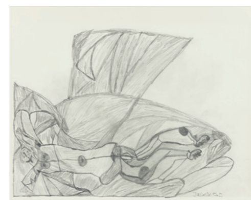
Jasmin Ludwig Jonas I, undatiert Bleistift auf Papier 50 x 70 cm Sammlung Würth, Inv. 11351

On the one hand, a forum is to be created in which their art can be exhibited, viewed, and discussed, yet on the other hand, the “special” or “disability” label pigeonholes these artists, marking them as outsiders of the “normal” art business and ascribes them a special role that prevents equal reception. However, as long as it is not yet a matter of course that exhibitions in galleries and museums will show works of art by people with and without disabilities side by side, there is still a need for opportunities to showcase art by people with disabilities as well as for a change in the broad consensus.