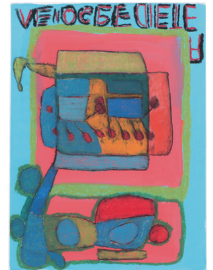
Dieter Jürgen Overhead mit Händen, 1997 Acryl und Ölkreide auf Papier 83,5 x 60,5 cm Sammlung Würth, Inv. 5341