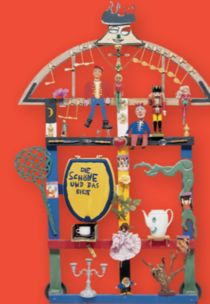
Martin Udo Koch Die Schöne und das Biest, 1999 Objekt, verschiedene Materialien 210 x 140 x 30 cm Sammlung Würth, Inv. 5574

Und genau hier setzt nun auch unsere jetzige Ausstellung an. Menschen mit Beeinträchtigungen haben unter Umständen eine andere Lebenswirklichkeit, andere Erfahrungen und sehen Dinge aus einem anderen Blickwinkel als Menschen, die ohne Unterstützung durchs Leben gehen. Aber es sind ebenso Wünsche, Sehnsüchte und Empfindungen, die sie